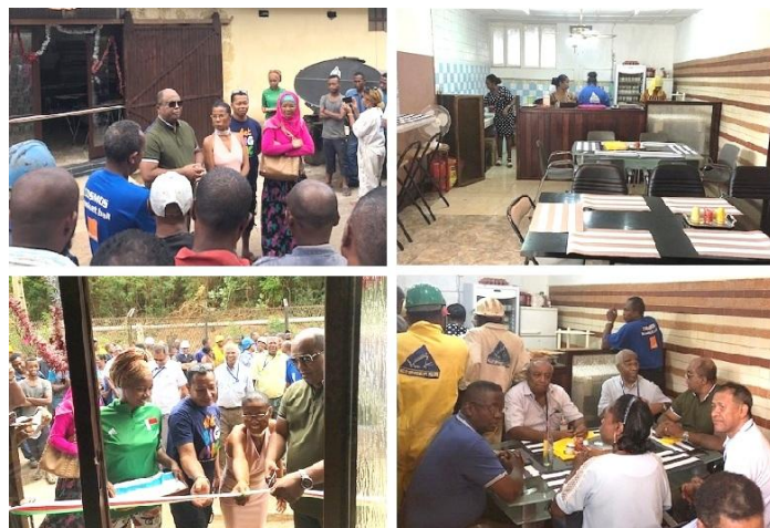
A gauche en haut : discours d'inauguration du Directeur Général en présence de nombreux travailleurs. A gauche en bas : cérémonie de coupure du ruban d'inauguration. A droite en haut : norme et confort de cette cantine entreprise. A droite en bas : premier service de restauration à destination des travailleurs.

Les horaires d'ouverture sont les suivantes : 6h00 à 6h30 et 9h00 à 9h30.