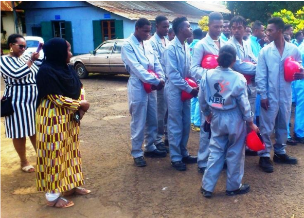
Les jeunes mahorais lors de la réception officielle au parvis du CFTPS.

En outre, 07 jeunes mahorais (photo ci-dessous) sont venus le 26 août 2019 renforcer l'effectif de nos jeunes apprenants au CFTPS pour une formation de découverte de métiers.