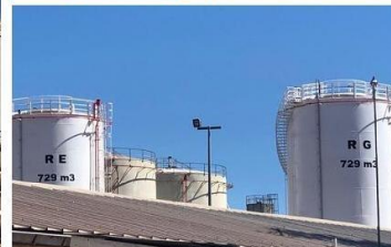
Photo 1 : bac E en phase de finition. Photo 2 : le DG de la SECREN SA, Abel NTSAY, et l'équipe de la SECREN SA lors de sa visite à Mahajanga avant la réception provisoire. Photo 3 : les bacs E et G fin prêts pour réception provisoire.

La SECREN SA est connue mondialement pour son savoir-faire et ses expériences dans le domaine de la réparation navale. La réception, le 14 août 2019 dernier à Mahajanga, des bacs appartenant à la Logistique Pétrolière SA met en exergue que cette renommée ne s'arrête pas là car la SECREN SA est également leader à Madagascar dans les grands travaux de diversification, à savoir : construction des bacs de transport (exemples : bac Baobab à Mahajanga, bac à pirogues transversal à Soalala, bac de déviation pour Soanerana Ivongo,...) ou encore construction et réhabilitation des citernes allant jusqu'à 729m 3 , mise en place des pipelines, création de réseau fuel oil, pour ne citer que ceux-là.