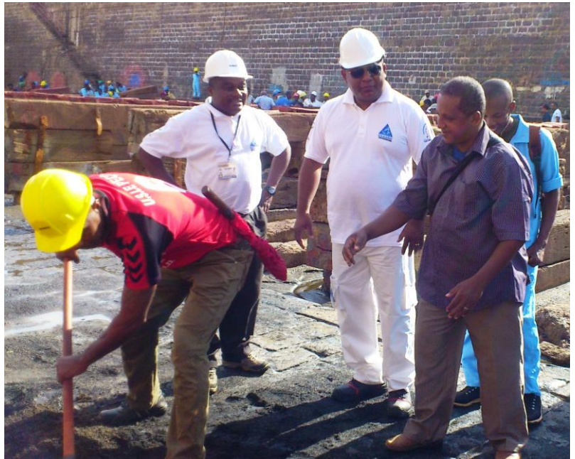
Le Directeur Général de la SECREN SA (au milieu) participant au nettoyage du bassin.

Ce « asa tagnamaro » consistait particulièrement au nettoyage du bassin de radoub (photos ci-dessous).