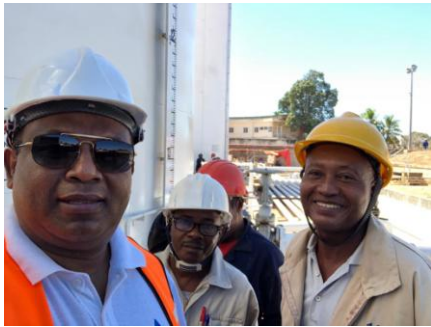
Une petite selfie du DG de la SECREN SA avec ses missionnaires pour marquer son passage au chantier PL SA à Mahajanga.

Le DG de la SECREN SA a également saisi cette opportunité pour rencontrer l'équipe de la SECREN SA.